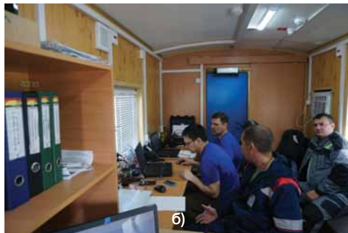
Рис. 2: Штаб-вагон. а) «мозговой шторм» при выборе верного решения; б) рабочая обстановка на едином пространстве Pic 2: In the headquarters vehicle a) "Brain storm" went on to choose the correct decision; b) Working environment within the integrated space

«мозговом шторме», позволяет быстро решать деловые вопросы и оперативно принимать решения. Супервайзер в штаб-вагоне создает обстановку «чувства локтя», выбирая формат общения для решения производственных задач, а электронные средства связи служат для согласования необходимых решений с центрами управления заказчика (рис. 2, а).